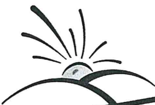
מאשר: עוזאל ותיק