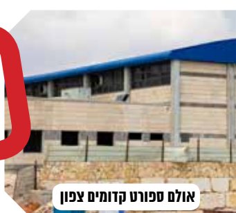
אולם ספורט קדומים צפון