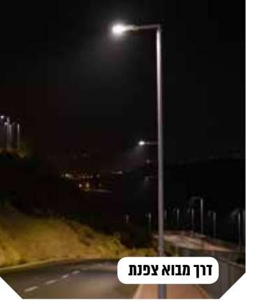
דרך מבוא צפנת