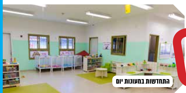
התחדשות במעונות יום