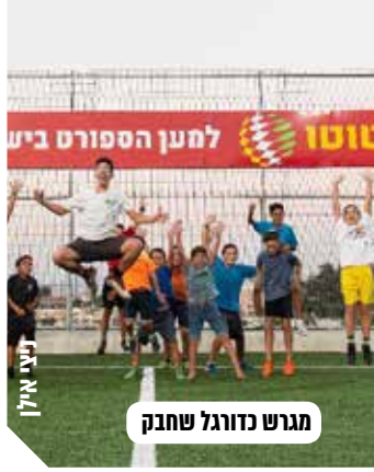
מגרש כדורגל שחבק