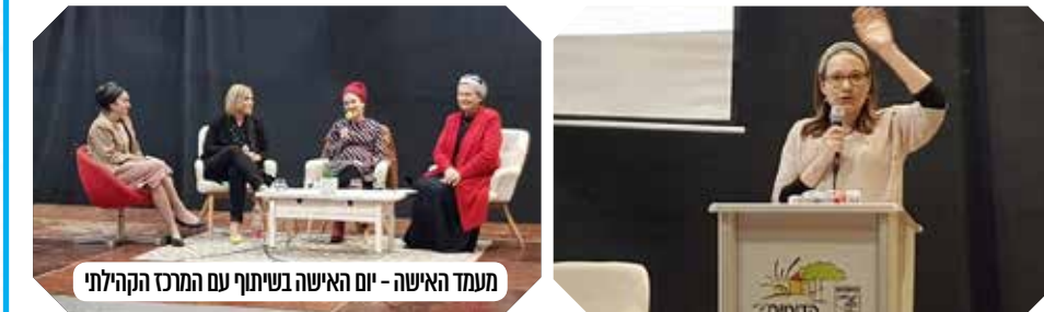
מעמד האישה - יום האישה בשיתוף עם המרכז הקהילתי