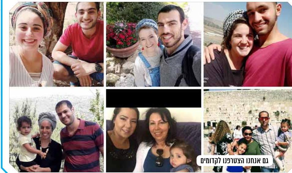
גם אנחנו הצטרפנו לקדומים